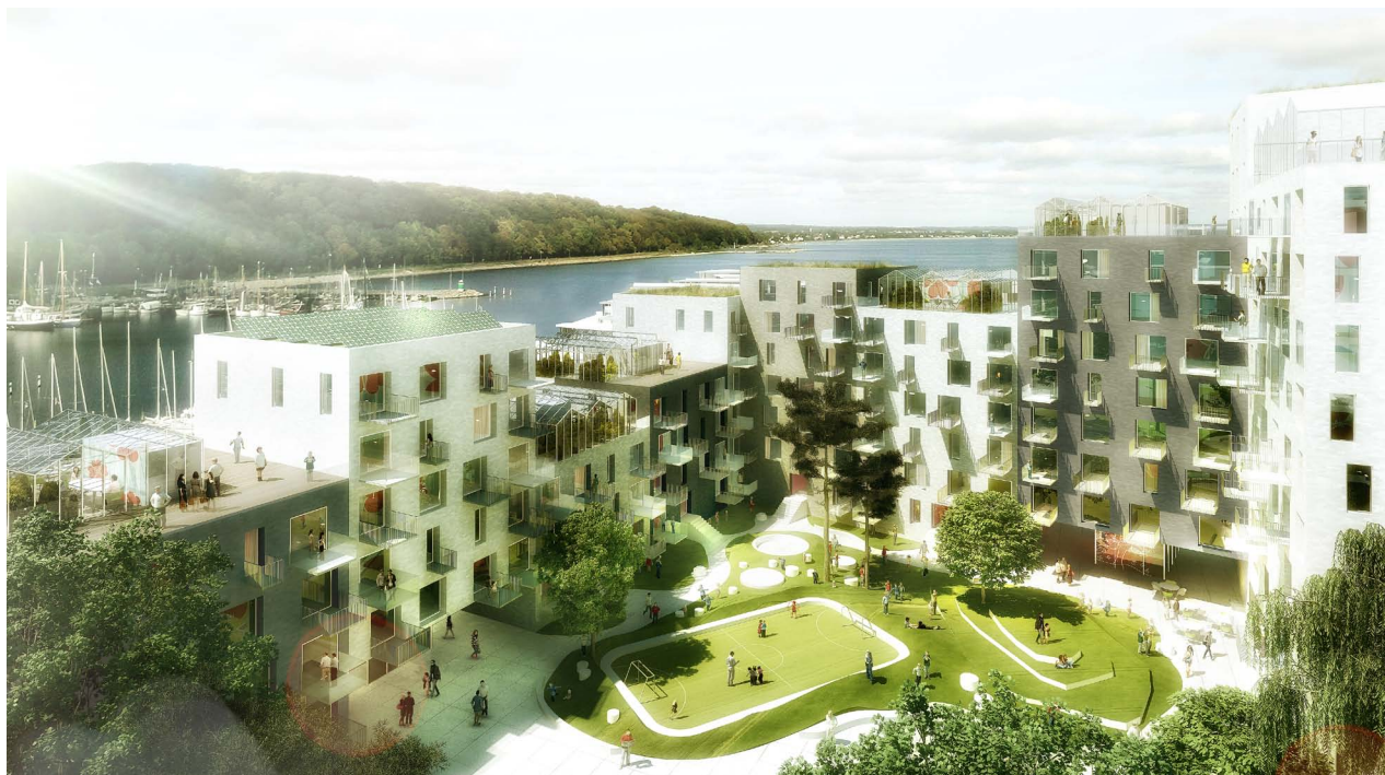
Visualisering - gårdrum, boliger og drivhuse på tagene (ADEPT/LUPLAU & POULSEN)

Fælles drivhuse på tagene, tagterrasser med udsigt over Aarhus bugt og et grønt, læfyldt gårdrum - alt i umiddelbar nærhed til Aarhus centrum. Sådan bliver rammerne om Brabrand Boligforenings 238 nye boliger, der bryder med havnens store skala og tidens ikonbyggerier. Projektet forventes at stå klar til indvielse i december 2013.