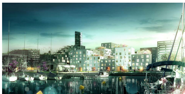
Visualisering fra lystbådehavnen (ADEPT/LUPLAU & POULSEN)

LUPLAU & POULSEN arkitekter er etableret i 2006 af Erik Luplau og Jørn Lyager Poulsen, der har mere end 25 års erfaring med arkitektur og ledelse gennem partnerskab i andre arkitektfirmaer. LUPLAU & POULSEN arbejder med bygningskunst, design og projektudvikling for offentlige og private bygherrer. Virksomheden ønsker at gøre en forskel, hvor funktion, æstetik og økonomi – i tæt og personlig kontakt med bygherren og samarbejdspartnere - er afgørende for arbejdet med den enkelte opgave.