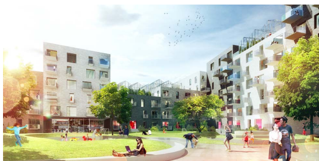
Visualisering af gårdrummet