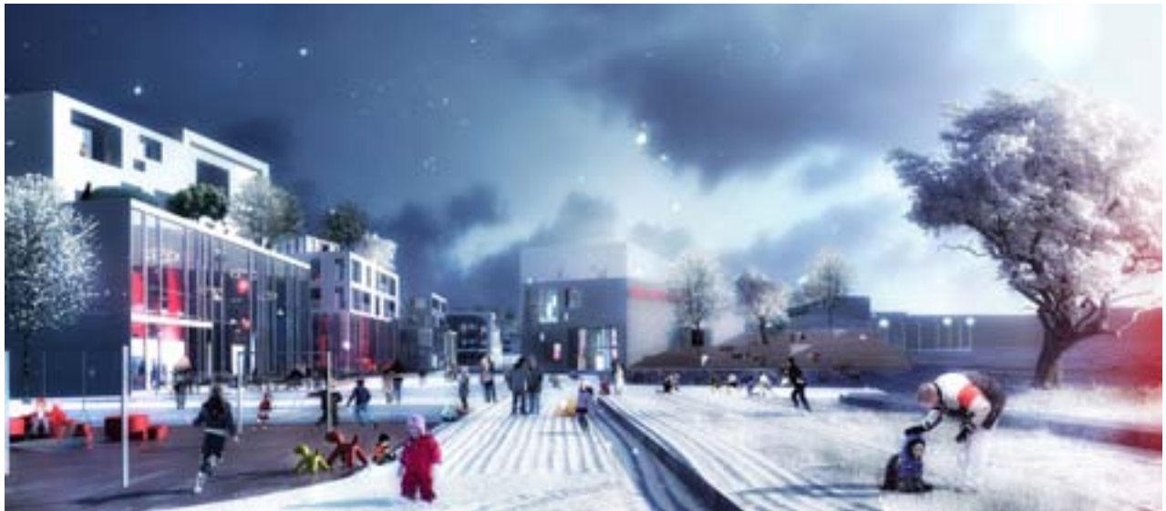
Aktivitetsplads i Asker Sentrums nye loop

Asker kommune i Norge fortsætter sin urbane udvikling med et større, mere levende by- og boligcentrum. Dark arkitekter (N) og ADEPT arkitekter (DK) med rådgiverteam har vundet den internationale konkurrence om byudvikling og udvidelse af Asker Sentrum. Projektforslaget "In the Loop" præsenterer en forenet, urban aktivitetsby for sport, samvær og oplevelser.