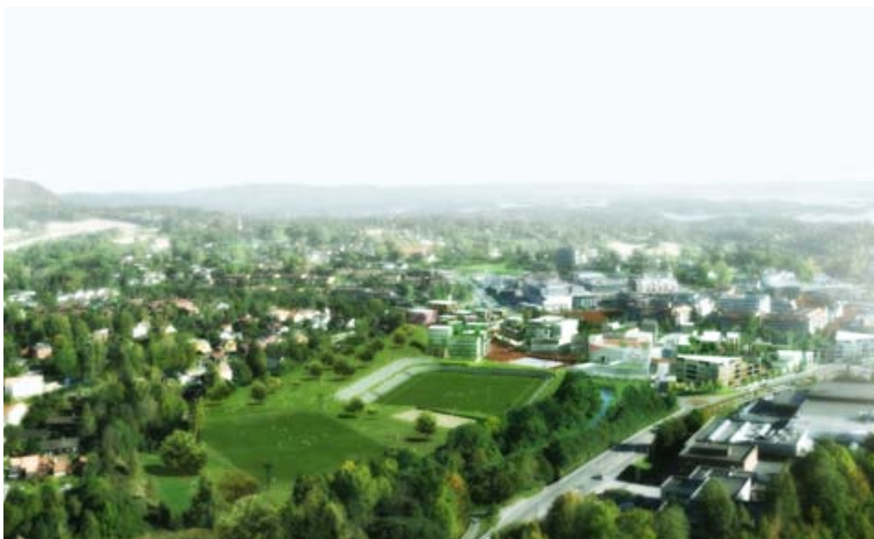
Billede på den overordnede strukturplan for Asker Sentrum