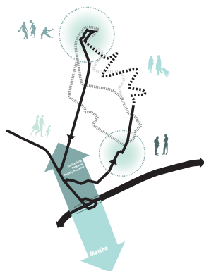
Netværk for alle