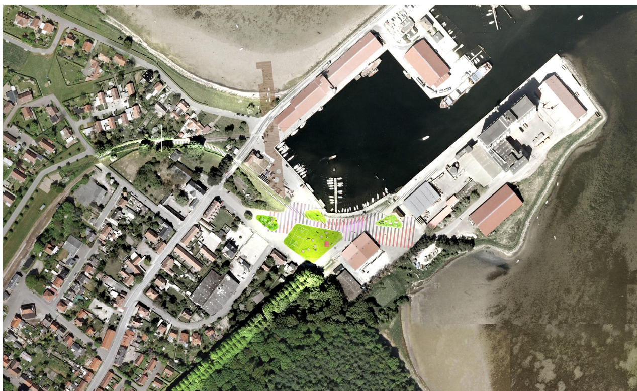
Havnepladsen i Bandholm

Landsbymiljøerne omkring Knuthenborg Park & Safari skal forstærkes og invitere besøgende til at fortsætte rejsen på det naturskønne og kulturelle Lolland. Med projektet "Fortællinger om Lolland" har Schønherr landskabsarkitekter og ADEPT arkitekter i samarbejde med Kuben Management og et konsulentteam vundet konkurrencen om Porten til Lolland .