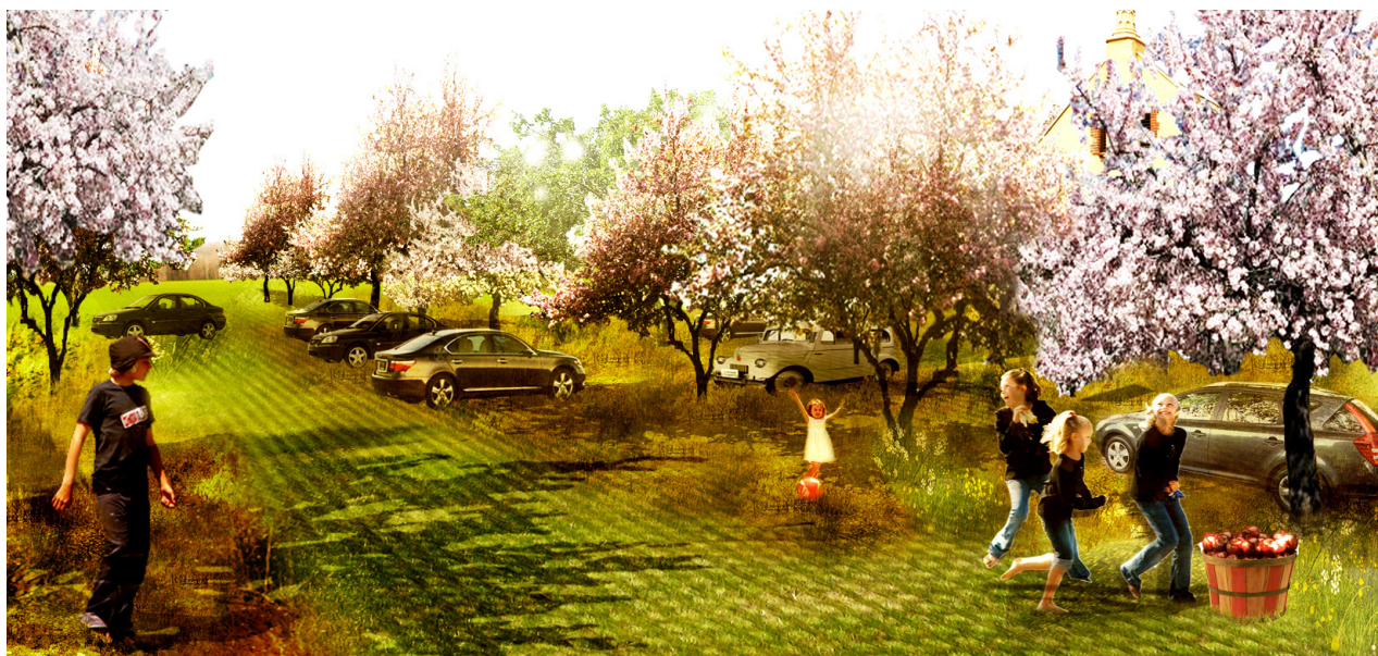
Parkeringsplantage i Hunseby-Maglemer