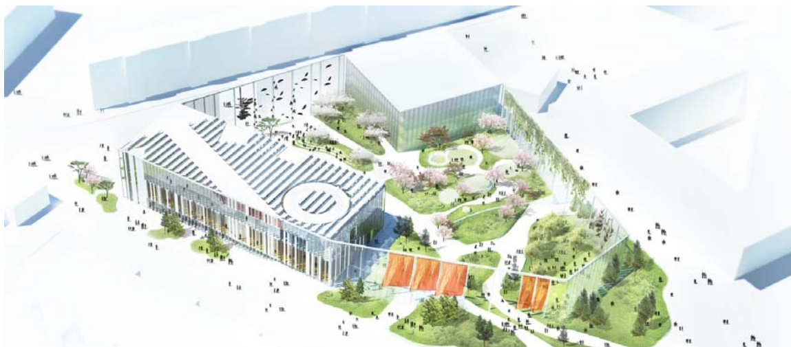
Billedtekst: MVRDV/ADEPT, oversigt over Kultur- og Bevægelsehuset med haven indrammet af det urbane gardin. Volumen øverst viser, hvor den kommercielle bygning skal placeres. Det nederste højre hjørne er reserveret til Kultur- og Bevægelsehus 2.

For mere information, flere billeder og diagrammer kontakt venligst: pr@mrvdv.nl eller press@adeptarchitects.com