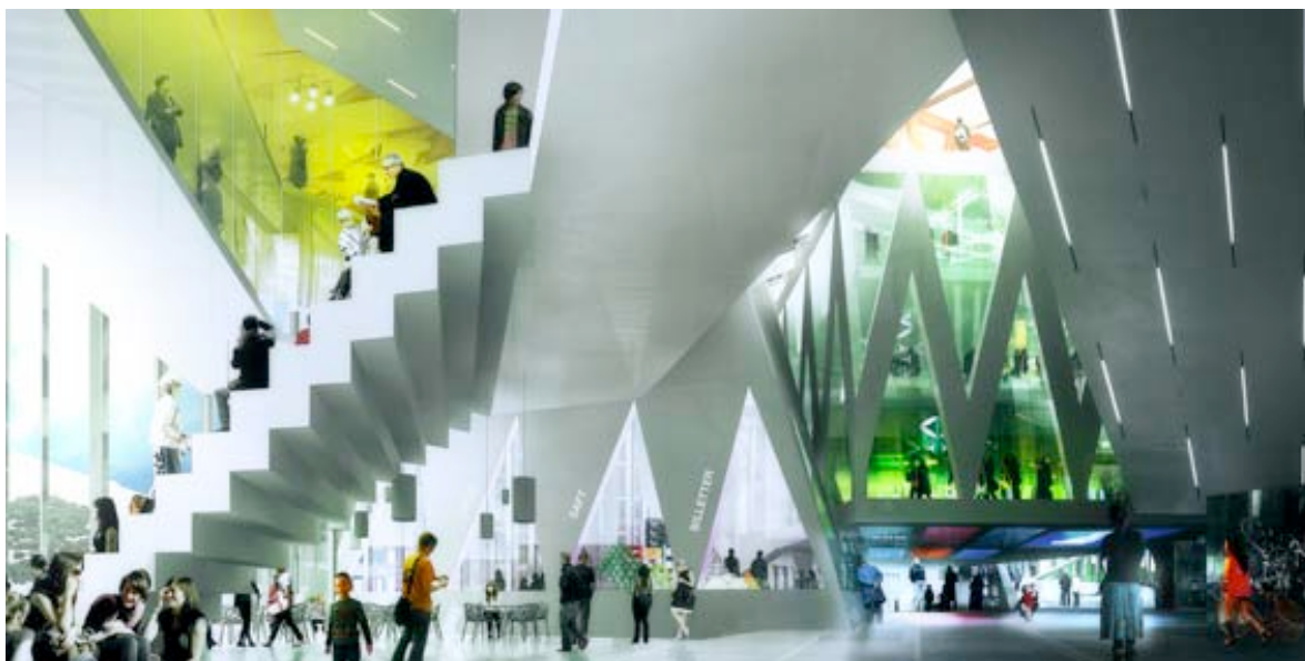
Billedtekst: MVRDV/ ADEPT, Kultur- og bevægelseshusets interiør Frederiksberg, Danmark

Realdania er en strategisk fond skabt med formålet om at initiere og støtte projekter, der forbedrer det byggede miljø. Fondens mission er at øge livskvaliteten for alle igennem det byggede miljø i Danmark. Lokale- og Anlægsfonden udvikler og støtter byggeri inden for idræt, kultur og fritid og tilbyder desuden rådgivning på området ud fra kravet om faciliteter af en arkitektonisk og funktionel kvalitet.